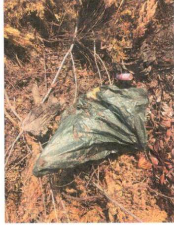
ODPAD V ZÁHRADNOM ODPADE